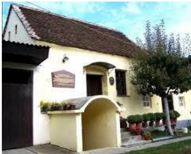
Huset, hvor Rudolf Steiner er født