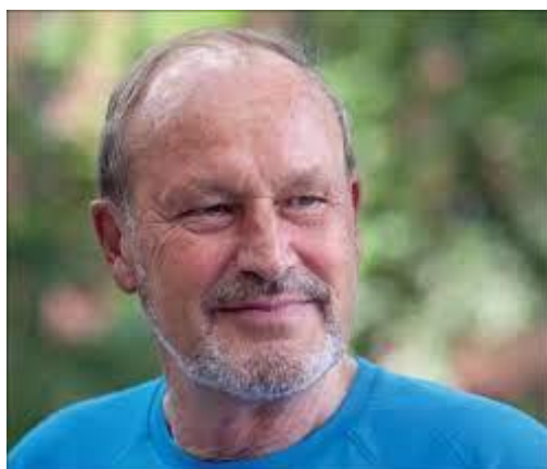
Per Fugelli (1943-2017)